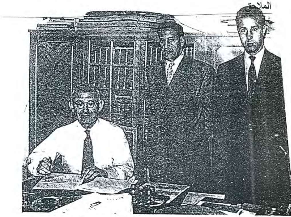
Avec Ahmed Ben Bella et Tewfik el-Madani.

صورة نادرة لفرحات عباس يتوسط كل من أحمد بن بلة و أحمد التوفيق المدني في القاهرة عندما ترأس فرحات عباس الحكومة المؤقتة