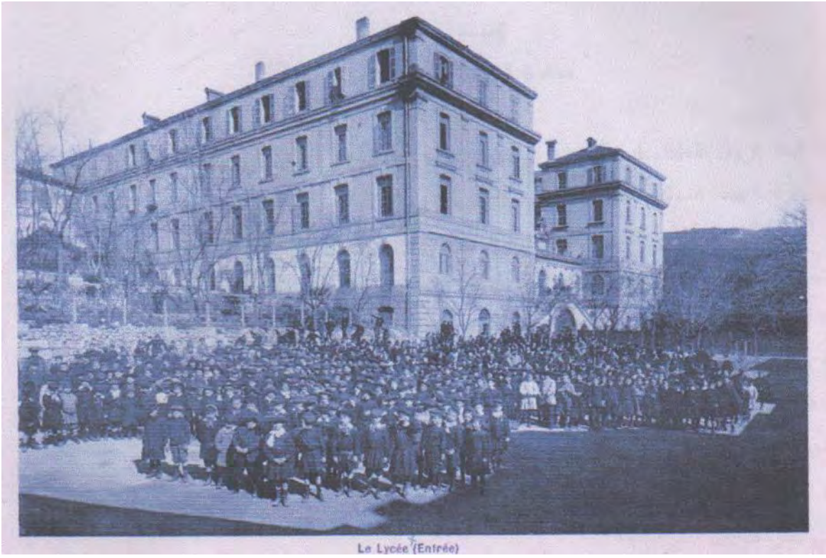
منظر آخر لثانوية دوق دومال