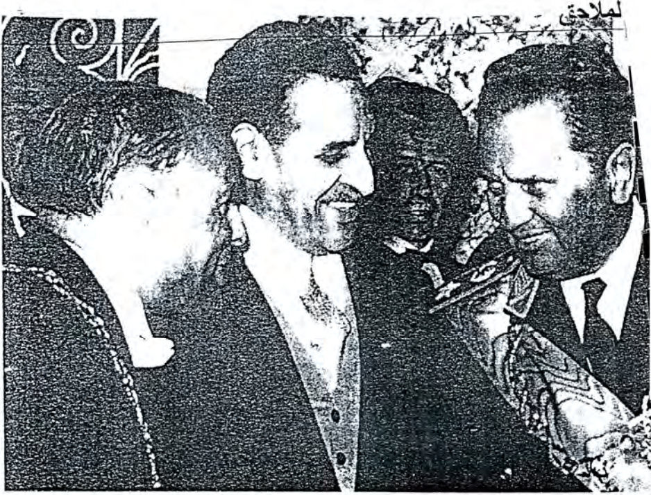
Avec le président Bourguiba et le maréchal Tito à Tunis en 1961.

فرحات عباس مع كل من الرئيس جوزيف بروز تينو و الحبيب بورقيبة خلال زيارة تينو إلى تونس